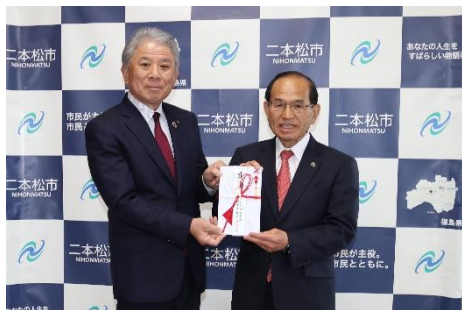
2026年4月27日 二本松市に贈呈